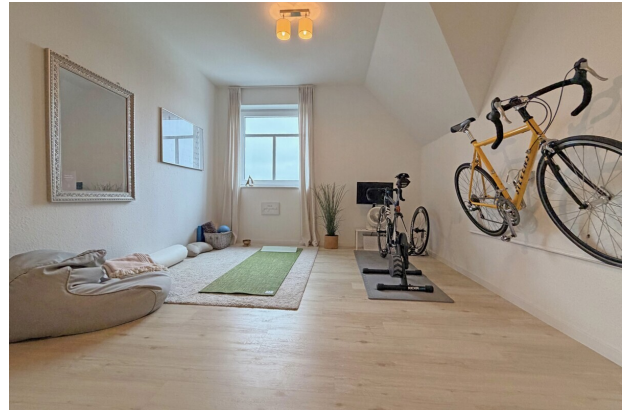
Schlaf- oder Fitnessbereich