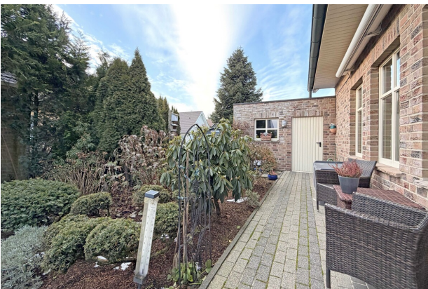
Garten mit Weg zur Garage