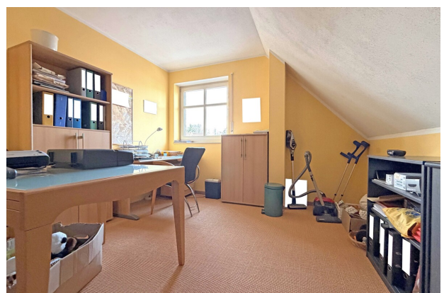
Zimmer 1 DG