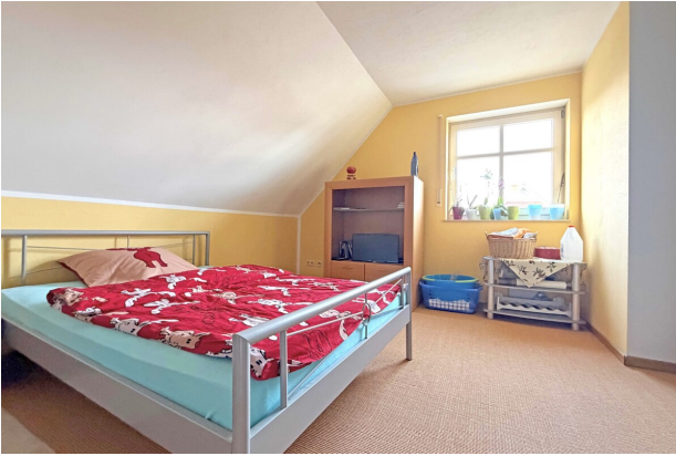
Zimmer 2 DG