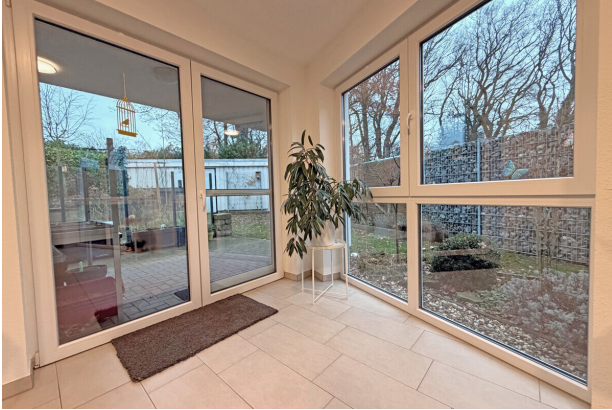
Wohnzimmer mit Zugang zum Garten