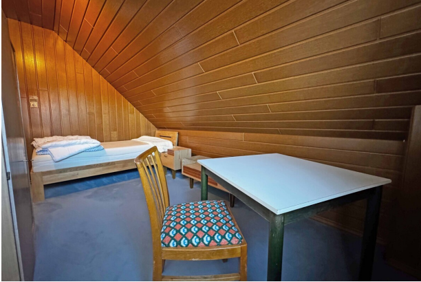
Zimmer 2 DG