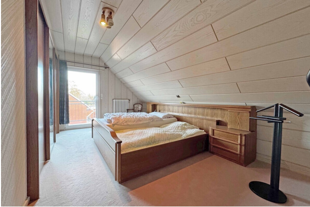
Zimmer 1 DG