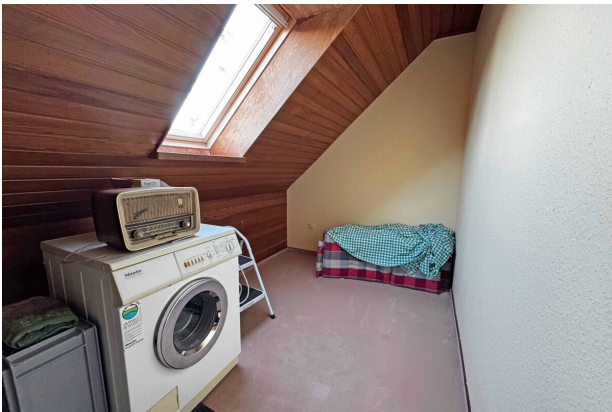
Zimmer 3 DG