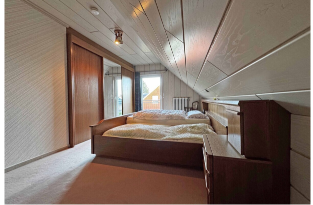
Zimmer 1 DG