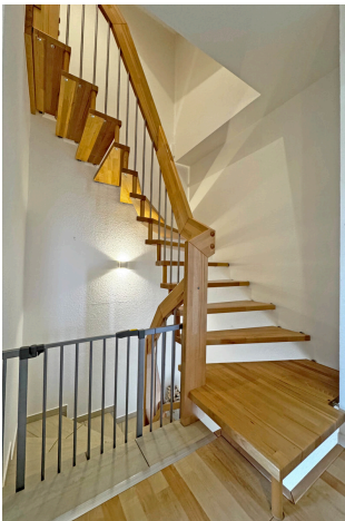
Treppenaufgang zum Dachgeschoss