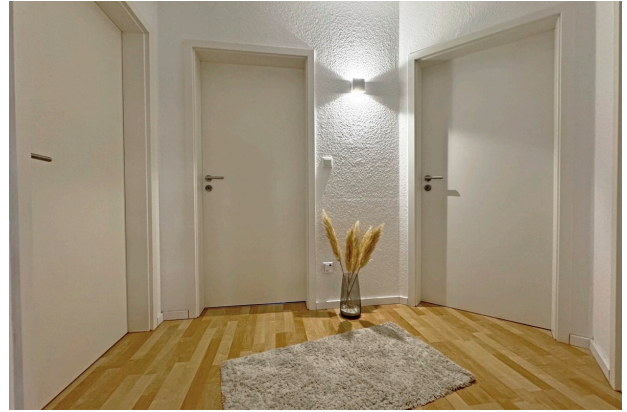
Großzügiger Flur Dachgeschoss