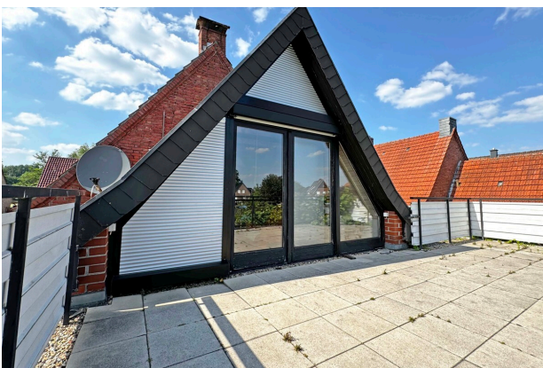
Studio mit Dachterrasse