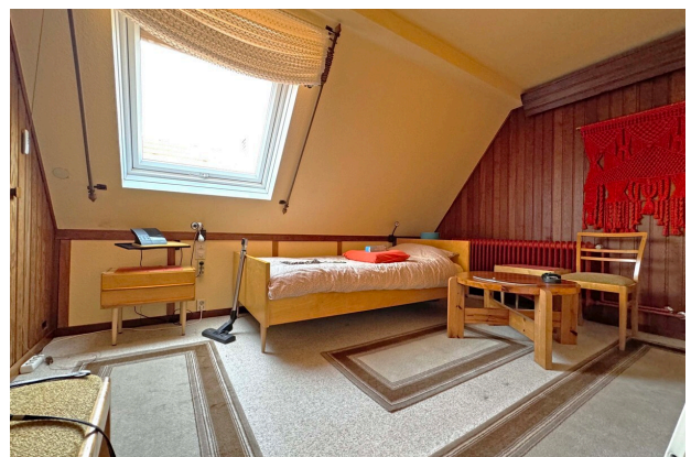
Zimmer 1 DG