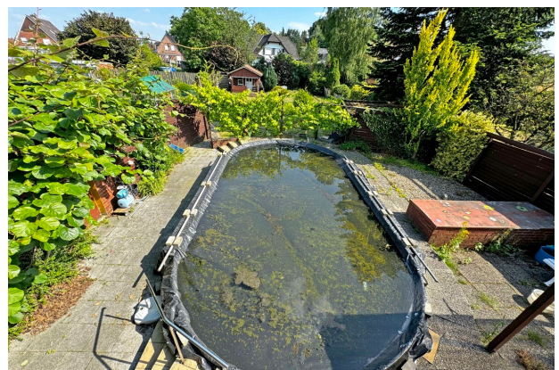
Blick auf den Pool