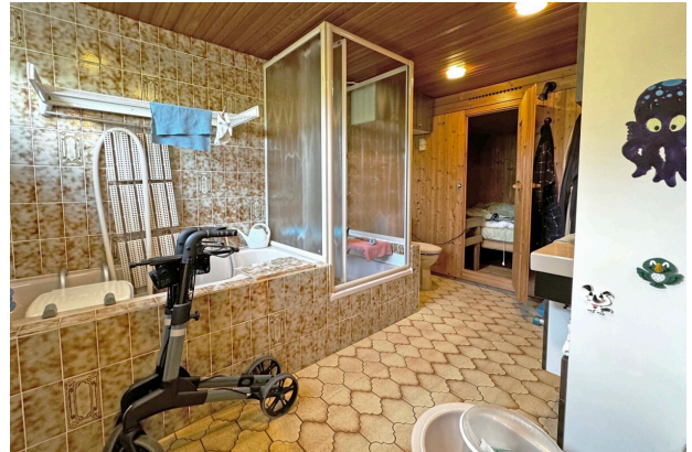
Bad mit Sauna