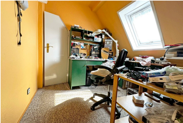
Zimmer 3 DG mit Zugang Studio