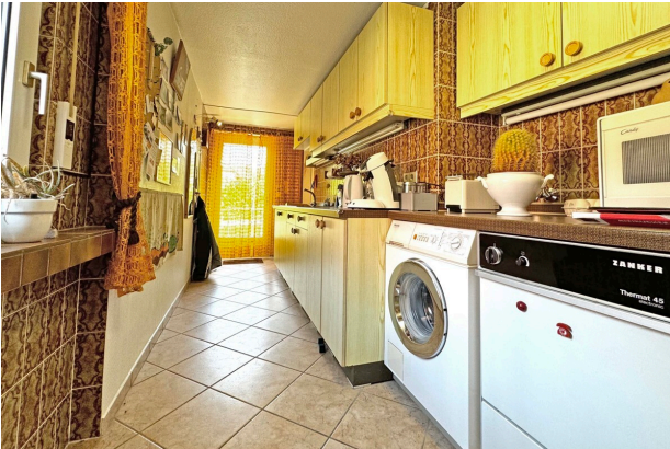
HWR mit Flur